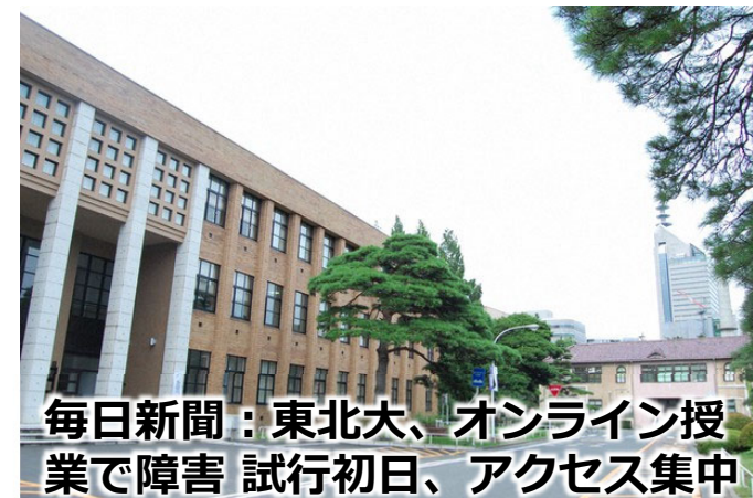
毎日新聞：東北大、オンライン授業で障害 試行初日、アクセス集中