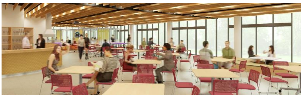
□ 管理施設(インタラクションプラザ)内観図