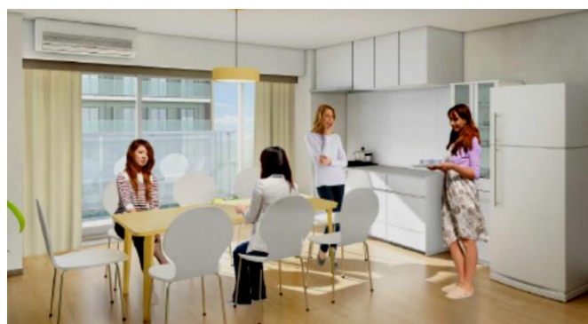
□ ユニット(オープンリビング)内観図