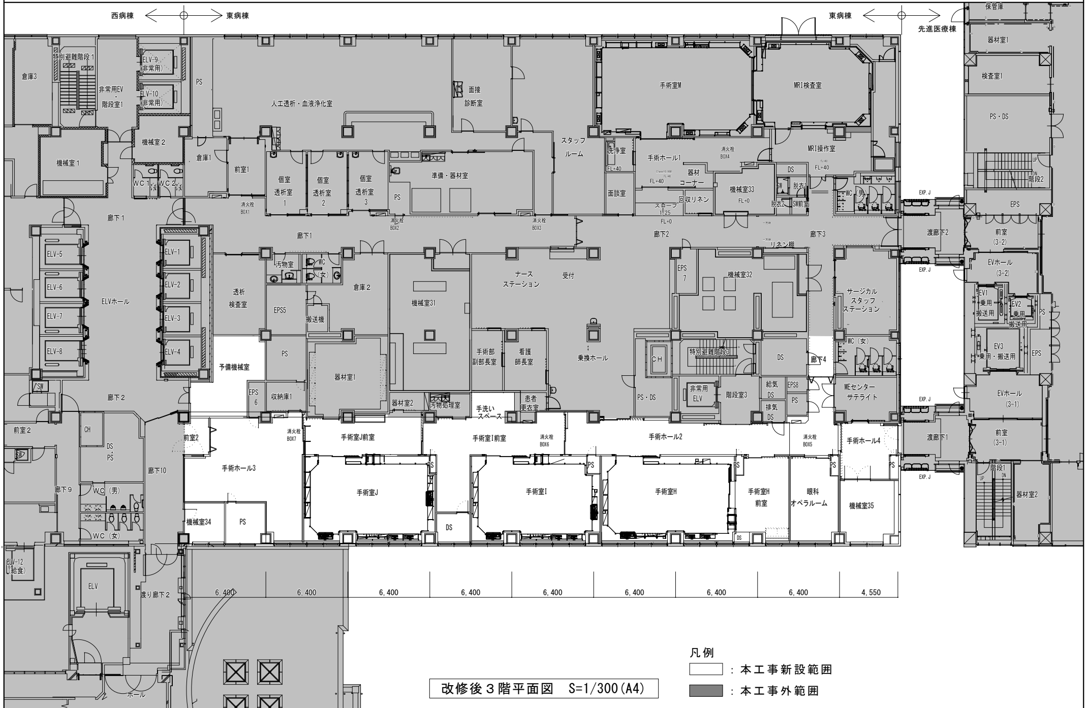
改修後3階平面図 S=1/300 (A4)