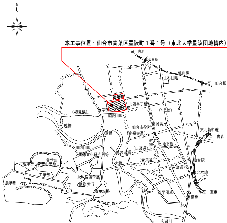
案内図 No Scale