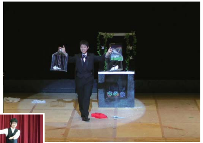
東北大学学友会奇術部HP http://tmj.s26.xrea.com/