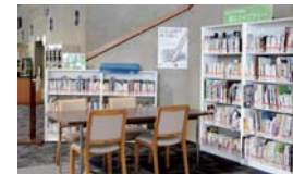
震災ライブラリー

東日本大震災後には、震災関連の図書、雑誌などを収集し、館内の「震災ライブラリー」で公開するなど、新しい取り組みも行っています。