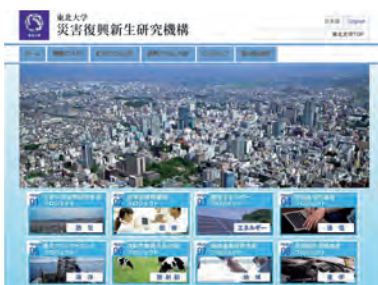
災害復興新生研究機構ウェブサイト