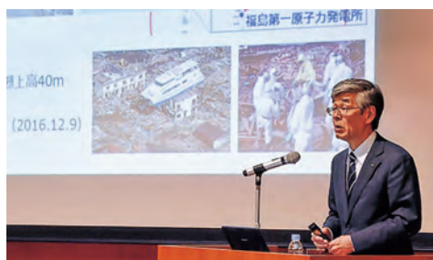
平成29年3月 災害復興新生研究機構シンポジウムの開催