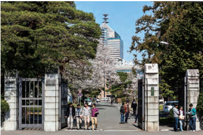
片平キャンパス 正門

明治19(1886)年4月 宮城県尋常師範学校 明治31(1898)年4月 宮城県師範学校 大正2(1913)年4月 宮城県女子師範学校 大正15(1926)年4月 宮城県女子専門学校 昭和18(1943)年4月 宮城師範学校 昭和24(1949)年5月 併合 昭和24(1949)年5月 包括 昭和24(1949)年6月 分校教育教養部 昭和32(1957)年4月 北分校に改称 昭和20(1945)年4月 宮城青年師範学校 昭和24(1949)年6月 包括