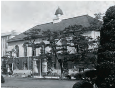
史料館 (旧図書館・昭和初期)