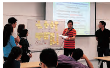
第3回 APRU-IRIDeS マルチハザードサマースクール (東北大学)