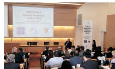
T.I.M.E. 年次総会 (東北大学)