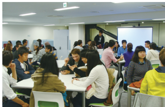
グローバル学習室