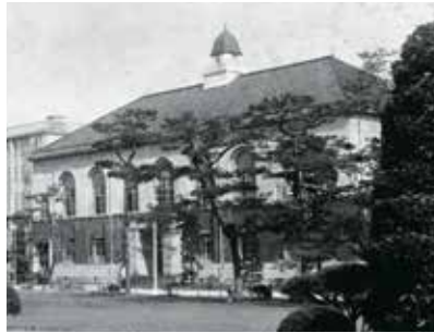
史料館 (旧図書館・昭和初期)

昭和22(1947)年4月 農学部 大正11(1922)年8月 法文学部 昭和24(1949)年4月 3学部に分立