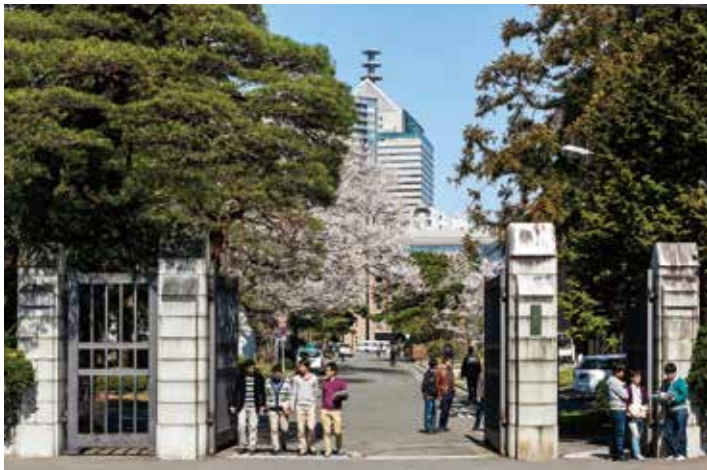
片平キャンパス 正門

昭和24(1949)年5月 併合 昭和24(1949)年5月 包括 昭和32(1957)年4月 北分校に改称 大正15(1926)年4月 宮城県女子専門学校 昭和18(1943)年4月 宮城師範学校 大正2(1913)年4月 宮城県女子師範学校 昭和24(1949)年6月 分校教育教養部 昭和20(1945)年4月 宮城青年師範学校 昭和24(1949)年6月 包括