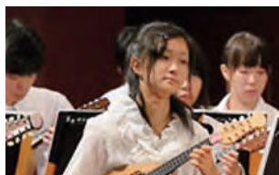
マンドリン楽部による発表

参加団体 (学内) マンドリン楽部、リコーダーアンサンブル、ジャズオーケストラ、学友会奇術部、美術部、写真部、書道部、(一般) 日本舞踊