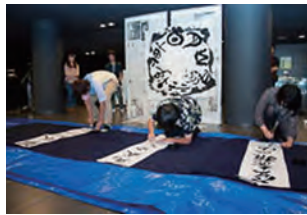
書道部によるパフォーマンス

参加団体 (学内)ブルーグラス同好会、青葉城址男声合唱団、書道部、邦楽部、モダンジャズ研究会、MUSICA (一般)合唱サークル若星Z