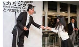
在校生と卒業生との親睦会第2部