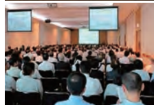
東北大学105周年関東交流会