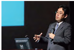
川島教授による講演