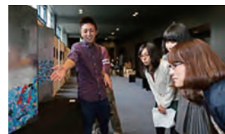
美術部・写真部・書道部による展示