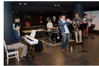
モダンジャズ研究会による発表