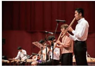
在校生によるステージ(邦楽部)

参加団体 男声合唱団、OB会合唱団、混声合唱団(現役)、混声合唱団同窓会「秋の子」、邦楽部、東北大学交響楽団