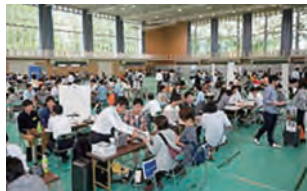
在校生と卒業生との親睦会第1部

同窓の先輩に学生生活の体験談を聞き、将来に関する相談を行うなど、在校生と卒業生が親睦を深める場として開催しました。