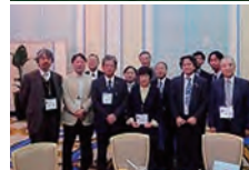
東北大学105周年九州交流会