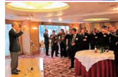
東北大学106周年校友会関西交流会