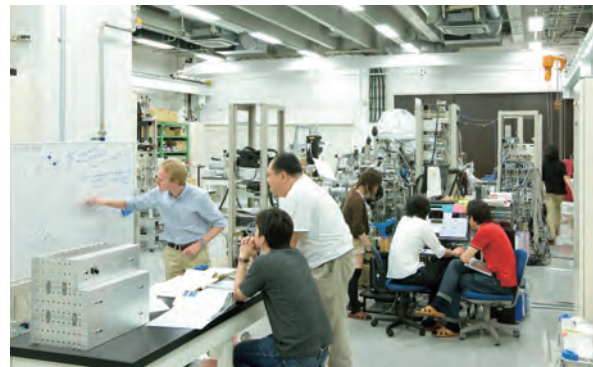
原子分子材料科学高等研究機構 研究風景