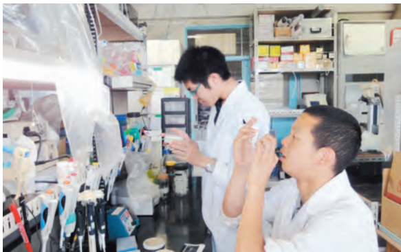
農学研究科生物産業創成科学専攻 研究風景