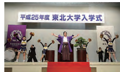
平成25年度入学式 平成25年4月4日