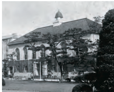
史料館(旧図書館・昭和初期)

明治20(1887)年4月 第二高等中学校 明治27(1894)年6月 第二高等学校大学予科 大正8(1919)年4月 第二高等学校 昭和24(1949)年5月 教育学部 昭和25(1950)年3月 廃止 昭和24(1949)年6月 分校第一教養部 昭和24(1949)年6月 分校第二教養部 昭和24(1949)年6月 分校第三教養部 大正11(1922)年8月 法文学部 昭和24(1949)年4月 3学部に分立