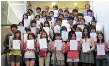
シドニー大学におけるスタディ・アブロード・プログラム修了式