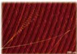
超高強度と高い弾性を併せ持つ金属ガラスナノワイヤの電子顕微鏡像。ナノワイヤの先端が振動している様子

数学ユニットは、抽象化・普遍化の観点を与え、物理学、化学、材料科学、バイオエンジニアリング、電子・機械工学の研究者とともに、材料の階層構造を解き明かすことで、材料科学の新たな学理の創出を目指します。