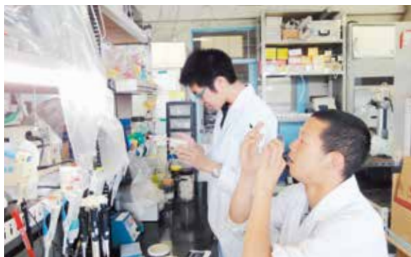
農学研究科生物産業創成科学専攻 研究風景