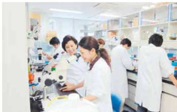
医学系研究科医科学専攻 研究風景