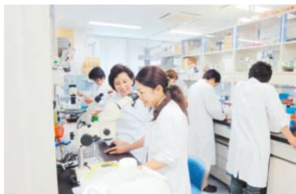
医学系研究科医科学専攻 研究風景