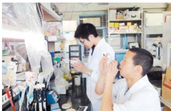
農学研究科生物産業創成科学専攻 研究風景