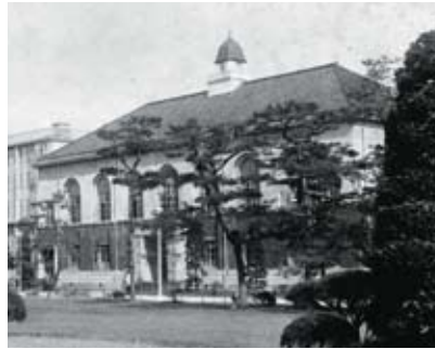
史料館(旧図書館・昭和初期)