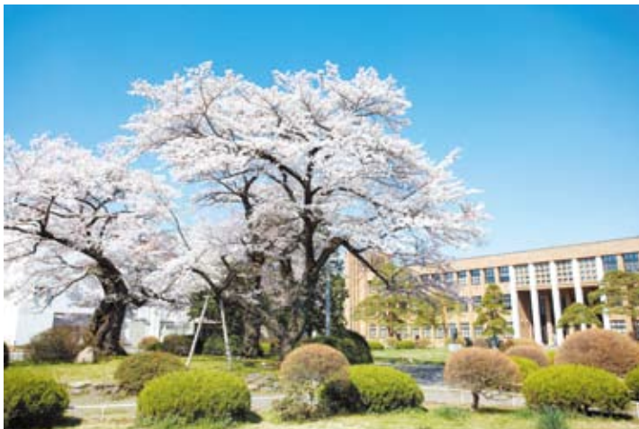
片平キャンパス 本部棟