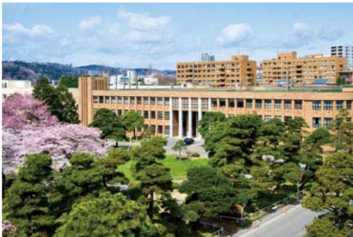
片平キャンパス_本部棟

明治19(1886)年4月 宮城県尋常師範学校 明治31(1898)年4月 宮城県師範学校 大正2(1913)年4月 宮城県女子師範学校 大正15(1926)年4月 宮城県女子専門学校 昭和18(1943)年4月 宮城師範学校 昭和24(1949)年5月 併合 昭和24(1949)年5月 包括 昭和24(1949)年6月 分校教育教養部 昭和32(1957)年4月 北分校に改称 昭和20(1945)年4月 宮城青年師範学校 昭和24(1949)年6月 包括