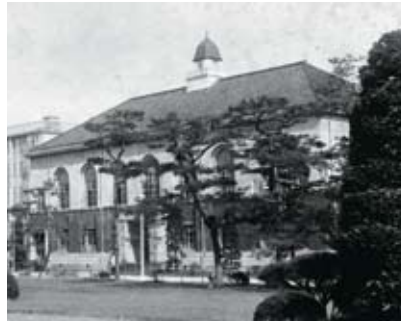
史料館(旧図書館・昭和初期)

大正11(1922)年8月 法文学部 昭和24(1949)年4月 3学部に分立 昭和22(1947)年4月 農学部