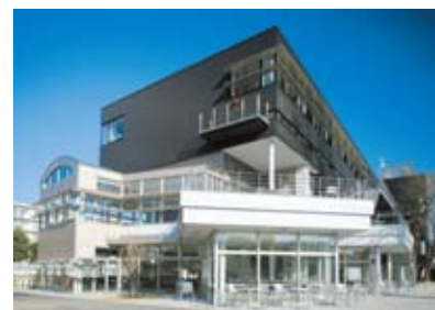
川内サブアリーナ棟