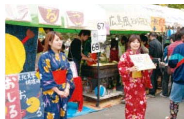
Fest der Tohoku-Universität