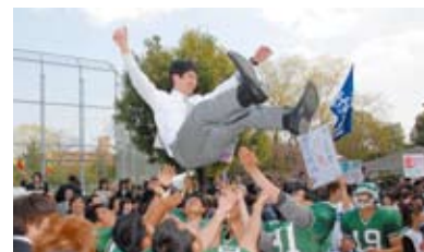
2009年开学典礼 2009年4月7日