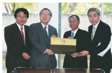
Acuerdo de intercambio académico firmado con el Institut Teknologi Bandung (el 4 de junio de 2008)