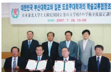
Acuerdo de intercambio académico firmado con la Universidad Nacional de Pusan (el 26 de julio de 2007)