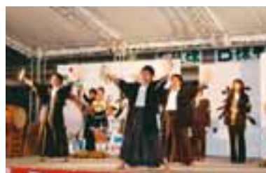
東北大学祭「百『華』繚乱」 平成19年11月2日～4日