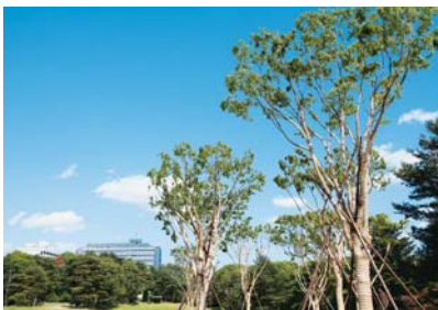
Zelkove-Umpflanzung von der Aoba-Straße in den neuen Aobayama-Campus