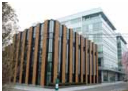
片平さくらホール