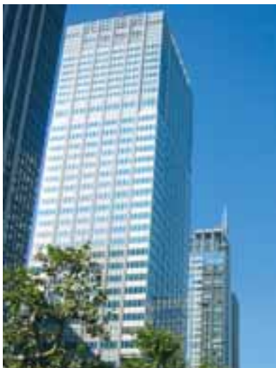
東京分室サビアタワー