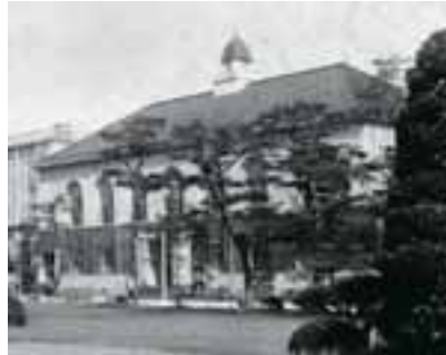
史料館（旧図書館・昭和初期）