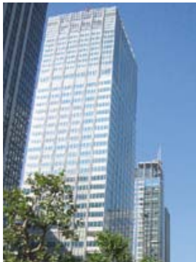
东京分室 Sapia Tower

1886年4月 宫城县寻常师范学校 1898年4月 宫城县师范学校 1913年4月 宫城县女子师范学校 1926年4月 宫城县女子专门学校 1943年4月 宫城师范学校 1949年6月 分校教育教养部 1949年5月 合并 1949年5月 总括 1957年4月 改称北分校 1945年4月 宫城青年师范学校 1949年6月 总括