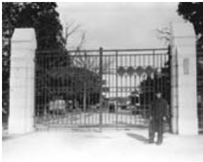
正门（昭和时代初期）

1906年4月 仙台高等工业学校 1912年4月 工学专门部 1919年5月 工学院 1921年4月 分离独立·仙台高等工业学校 1944年4月 仙台工业专门学校