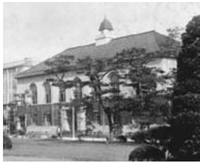
史料馆（旧图书馆·昭和时代初期）

1887年4月 第二高等中学校 1894年6月 第二高等学校大学予科 1919年4月 第二高等学校 1949年5月 教育学部 1949年5月 总括 1950年3月 停办 1949年6月 分校第一教养部 1949年6月 分校第二教养部 1949年6月 分校第三教养部