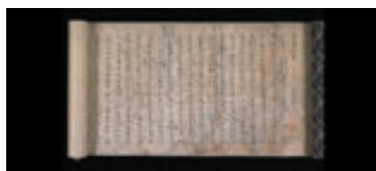
史記 孝文本紀第十