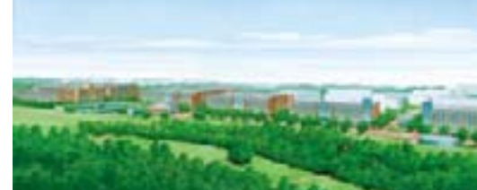
Aperçu panoramique du Centre commercial du campus

Cet espace ouvert est situé sur une colline qui fait face au parc de l'université et surplombe le campus. Depuis ce point, il est possible de voir tout le nouveau campus. La construction d'un bâtiment y est prévue.