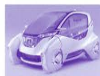
▲ホンダ マイクロコミューターコンセプト