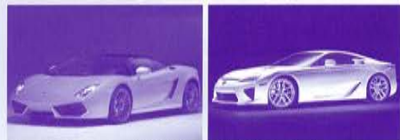
▲ランボルギーニ ガヤルド ▲レクサス LFA