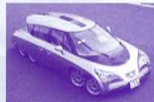
▲慶應義塾大学のEV エリーカ