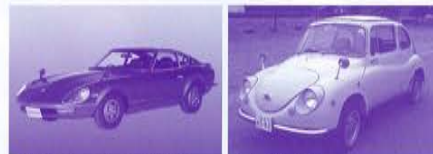
▲日産 フェアレディ240ZG (1972年) ▲スバル360 (1968年)