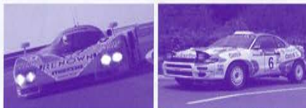
▲マツダ 787B ▲トヨタ セリカGT-FOUR (WRC仕様)