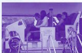
▲シートベルトの効果を感じる「シートベルトコンビンサー」(協力: J A F 宮城支部)