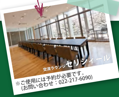
交流ラウンジ セリシイール ※ご使用には予約が必要です。 (お問い合わせ：022-217-6090)