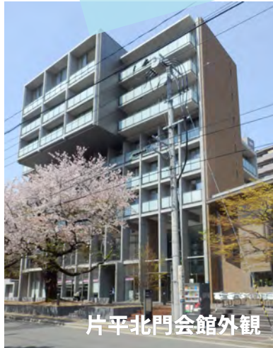
片平北門会館外観

建物は歴史のある片平キャンパスらしくスクラッチタイルを用いて、全体的に落ち着いた色を基調としています。