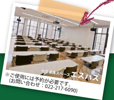
社会連携スペース エスパス ※ご使用には予約が必要です。 (お問い合わせ：022-217-6090)

同じ階にレストラン萩があり、直接入店できます。 また、1階には、さくらキッチン(食堂)やさくらショップ(売店) があり、エレベータで行くことができます。